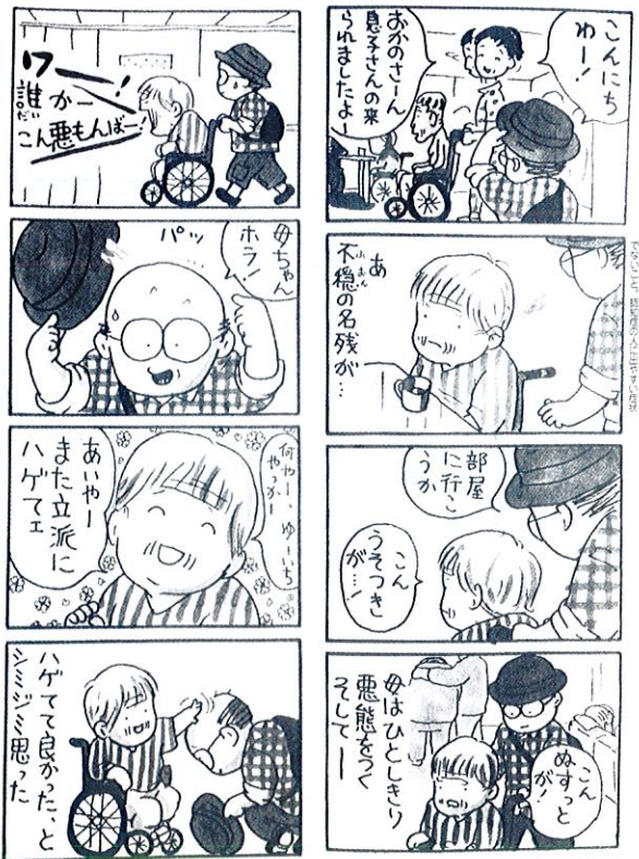
「ペコロスの母に会いに行く」より ©岡野雄一

主催 ひょうご聴障ネット【(公社)兵庫県聴覚障害者協会・NPO 法人兵庫県難聴者福祉協会・神戸市難聴者協会・NPO 法人兵庫盲ろう者友の会・(社福)ひょうご聴覚障害者福祉事業協会・兵庫手話通訳問題研究会・兵庫県手話サークル連絡会・兵庫県要約筆記サークル連絡協議会】