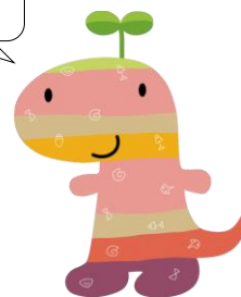
丹波竜のちーたん