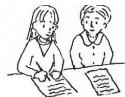
手書きノートテイク