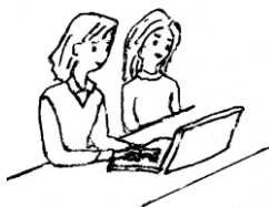
パソコンノートテイク