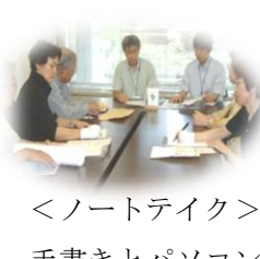
<ノートテイク> 手書きとパソコン の方法があります