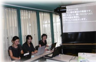
<パソコン要約筆記>